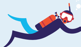
Travail en milieu hyperbare 60 interventions par an