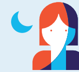
Travail de nuit 120 nuits par an

› A savoir : le dispositif entre en vigueur en 2015 pour ces 4 facteurs et en 2016 pour 6 autres.